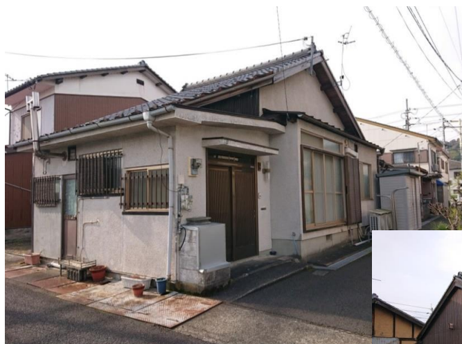
北東から見て、手前道路は公道、北道は私道。