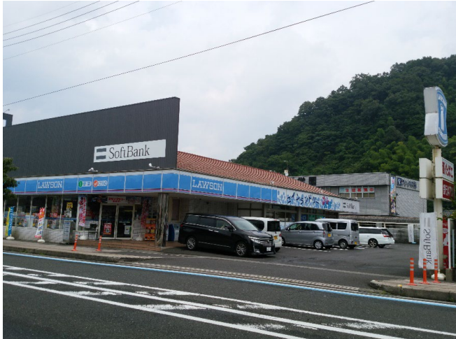
■ 旧写真で、現在はローソンは退店した空き店舗 です。